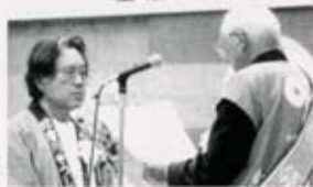
写真・河童共和国（八代）へ「河童特別大賞」