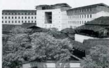
【写真】 サミット会場の飯坂温泉・摺上亭大鳥