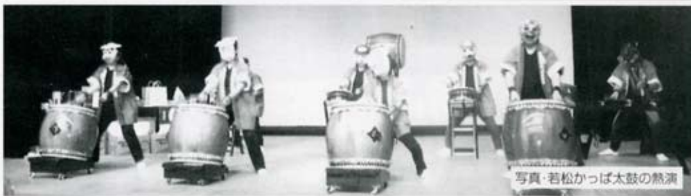
写真・若松かっぱ太鼓の熱演