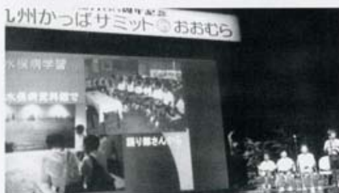
写真・小学生による環境フォーラム、 熊本県水俣市瀬出小学校の報告