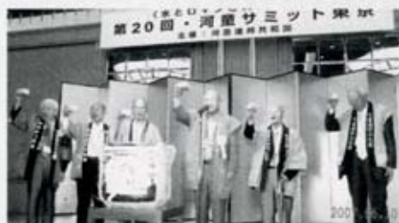
写真・サミットの成功を祝して乾杯