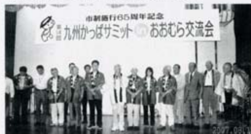
写真・08年度の九州河童サミット開催を受託した 相良村（さがらっぱ）代表団