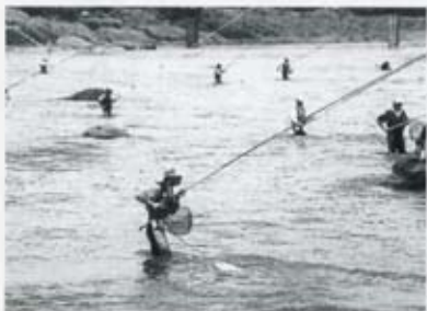
【写真】 日本一の清流・川辺川 (相良村村勢要覧から)