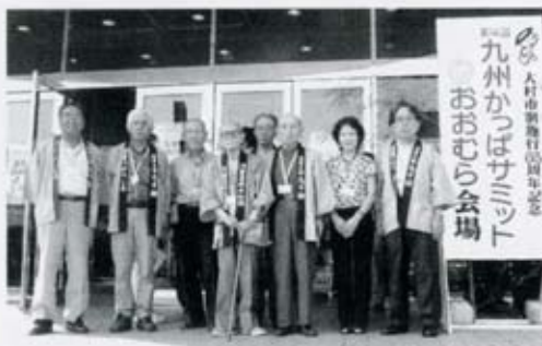
写真・大村サミットに出席の河童共和国代表団